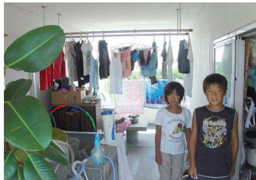
FIG. 2 Apartaments Kittagata, 7 d'agost de 2008, 11:20 a.m.